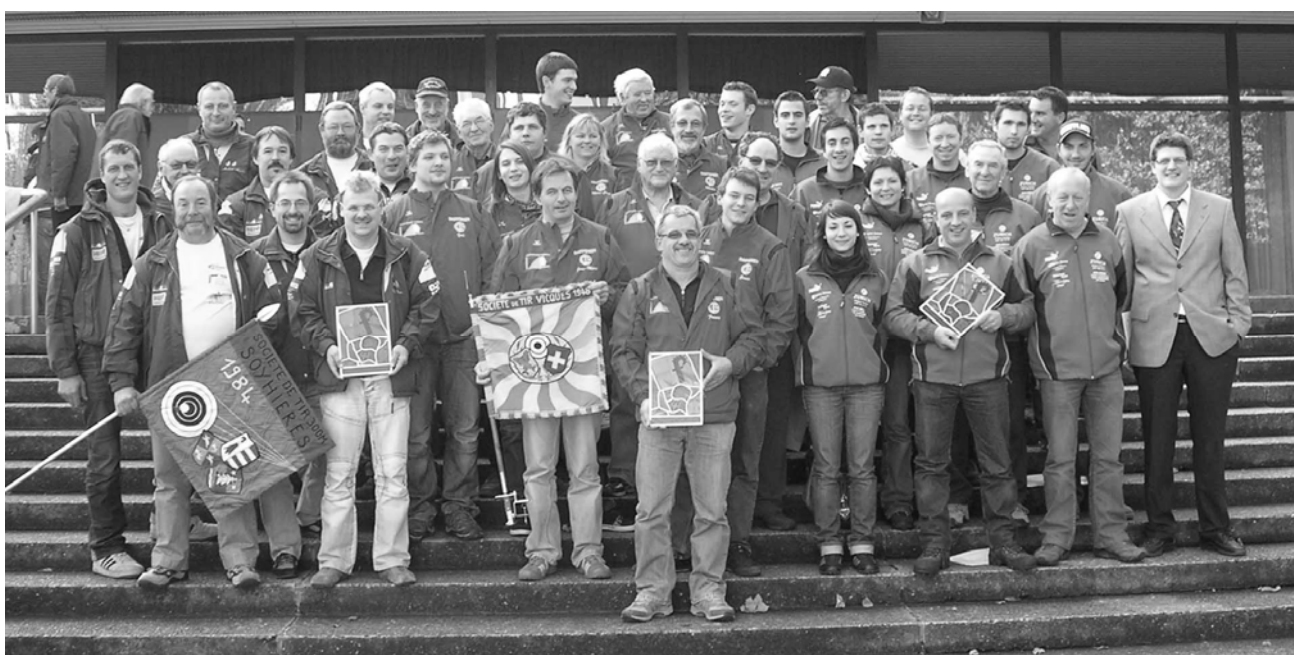
Finale du championnat suisse de sections :

Lors des qualifications, en catégorie 1, Soyhières et Bassecourt-Develier se qualifient aisément avec respectivement 98.113 (11 ème rang) et 97.324 (20 ème rang) de moyenne. Au deuxième tour, les résultats exceptionnels rencontrés par les meilleures sociétés de Suisse ont suscité bien des interrogations. Höri/ZH remporte ce second tour avec 105.317pts de moyenne. Ce mode de calcul est donc