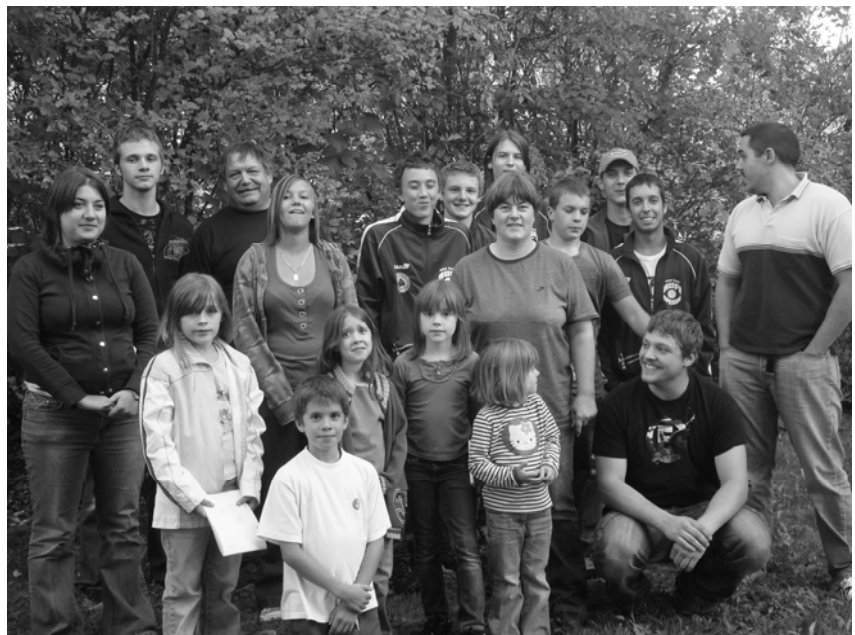
Les participants avec les accompagnants

Comme chaque année, je lance un vif appel aux sociétés 10-25-50m qui sont prêtes à offrir 3 heures pour les jeunes inscrits au passeport-vacances. Prenez contact avec moi ou directement avec le Centre culturel. Vous pourrez vous inscrire déjà en mars sur le site et dans l'agenda transmis aux écoliers. Ensuite veuillez m'annoncer la date prévue trois semaines avant le cours et vous aurez des