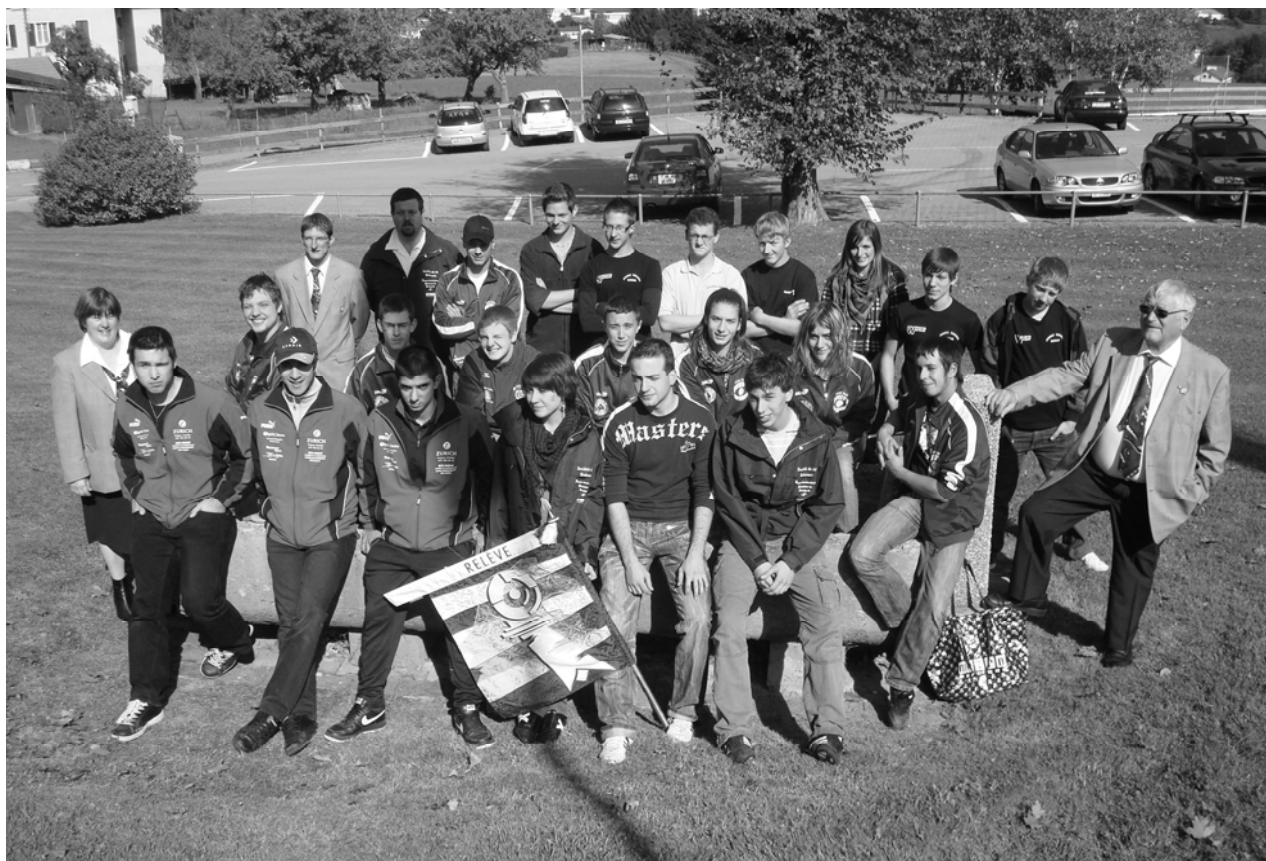
Le Jura vice-champion romand