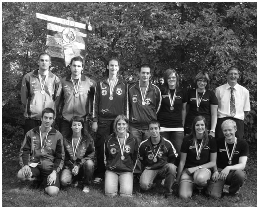
Podium de la finale jurassienne de groupes :

La finale du championnat de groupes des jeunes tireurs a eu lieu le 22 août dans les installations de tir de la Lovère à Bassecourt. Un temps radieux accompagnant les jeunes, les résultats furent à la hauteur et de nombreuses surprises ont agrémenté cette finale réunissant les 12 meilleurs groupes à l'issue du tir de section, du tour qualificatif à domicile et le tour de la journée de district. Le quart de finale débute sur les chapeaux de roues : Corban II prend la tête avec un total de 352pts devant Vicques I 348pts et Corban I 346pts,