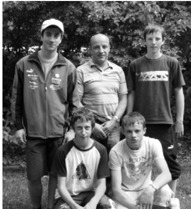
Corban , vainqueur du challenge Claude Hêche.