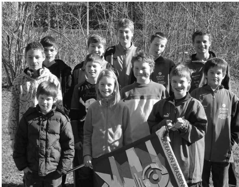
L'équipe jurassienne à la finale FST région ouest à Burgdorf

La finale de la FST est réservée aux participants des cours de la relève ayant suivi au moins 15 leçons du cours J&S « tir sportif ». Cette finale est réservée aux jeunes de moins de 16 ans et marque la fin des cours pour les régions romandes. Ils se sont qualifiés par 3 tests d'aptitude à la