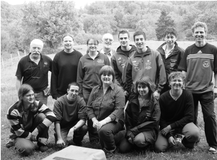
Les participants et instructeurs du week-end pour le cours de base.

s'est montré satisfait de la structure du cours.