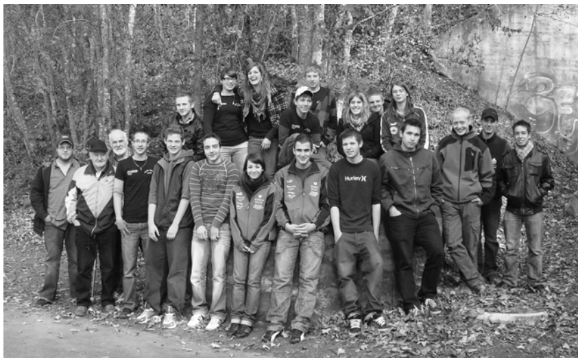
Groupe des jeunes et vétérans